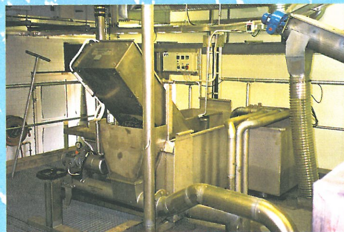
Esikäsittelylaitteiden asennus välppä- ja jakolaatikkoineen on nopeaa ja vaivatonta niin uusille kuin vanhoillekin laitoksille.