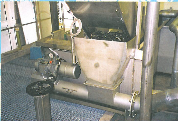
Työntövoimallaan välpepuristin pakkaa ja kuivattaa sekä siirtää sen putkea pitkin jätekonttiin